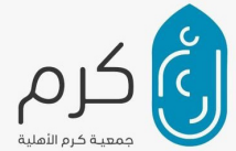
كرم جمعية كرم الأنمية